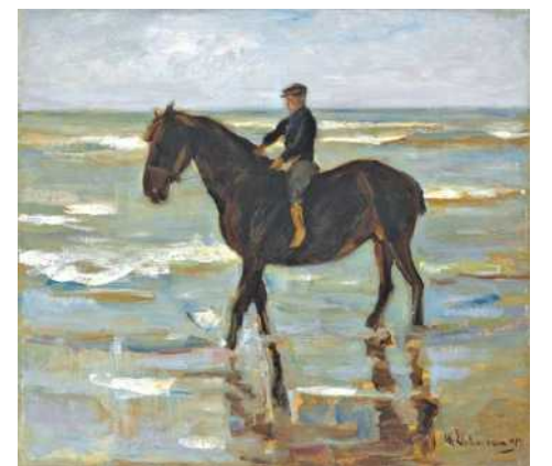
Max Liebermanns »Reitender Junge«

Erstaunlich viele weitere Werke deutscher Künstler aus deutschen Sammlungen kamen und kommen in dieser Woche in London zum Aufruf. Darunter auch solche, für die sich Sotheby's oder Christie's noch vor einigen Jahren nicht interessiert hätten, die sie nun aber deutschen Auktionshäusern