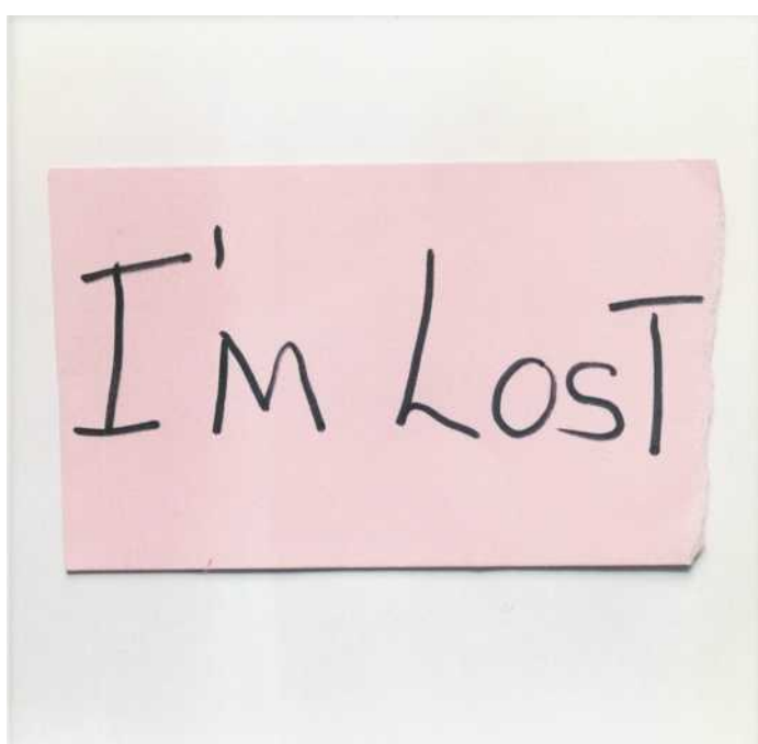
Notizen einer Ehe: Aus dem Nachlass des Künstlers Keith Arnatt zeigte die Galerie Sprüth Magers die Serie »Notes from Jo« (1991 bis 1995, Preis: je 4000 Euro)

Abb.: Keith Arnatt Estate, Fine Art Partners und Sprüth Magers (2); Christie's Images Limited 2016 (3)